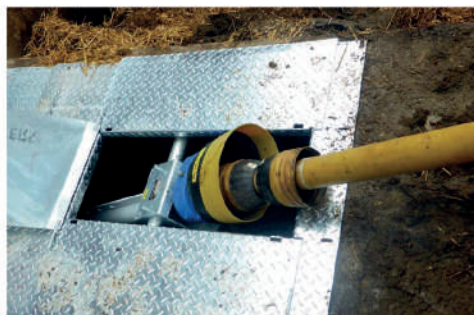
Anwendungsbeispiel mit Zapfwelle

Der Slalommixer SLT für Schlepperantrieb ist besonders für kleine Kreisläufe (100m) geeignet. Das Rührwerk ist festeingebaut und kann auf Wunsch mit einem Umschalt- oder Winkelgetriebe nachgerüstet werden. Auch eine Elektronachrüstung ist möglich. Die spezielle Form des Flügels bei Peters ist grundsätzlich aus Edelstahl und das einstellbare Gegenseidmesser erlaubt ein optimales zerkleinern und Homogenisieren von strohhaltiger Gülle.